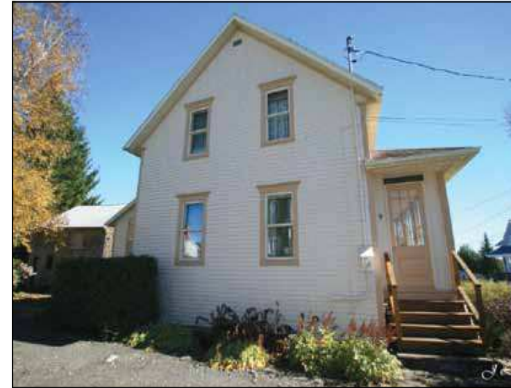
Germaine Audet, Saint-Camille